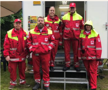
Samaritervagten på Sjællandsfestivalen.

Vi ser hvert år frem til vores vagt på Sjællandsfestivalen, da stemningen altid er helt fantastisk, og vi bliver taget godt imod. Mange af de besøgende og frivillige, som husker os, er også gengangere fra de forrige år, og de kommer altid forbi og hilser. Tak for en god festival.