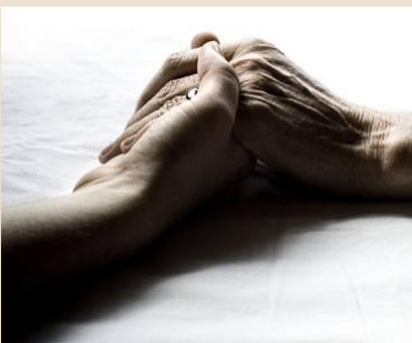
"Ingen skal dø alene".