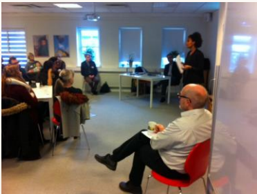
Der var fyldt med tilhørere.