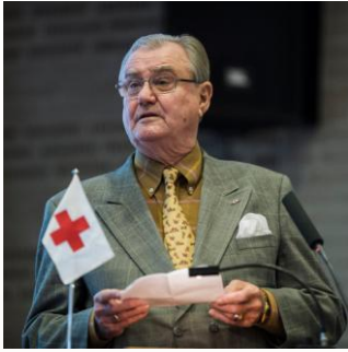
H.K.H. Prins Henrik, protektor for Røde Kors i Danmark.