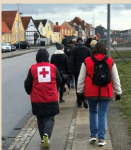
Gå sammen i Korsør.