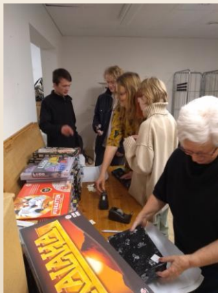
Unge fra FGU pakker mandelgaver.