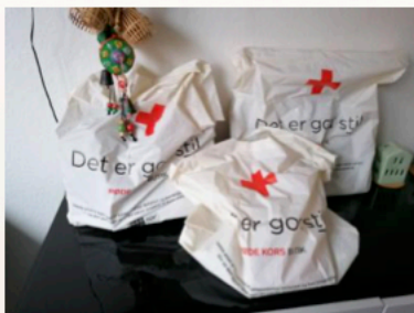
Røde Kors godteposer.

De gamle uniformer har ligget hengemt i vores depot i nogen tid, men dukkede op ved en generel oprydning. Vi blev enige om, at de vinterjakker, som samaritterne havde brugt, var alt for gode at smide ud. De mange Røde Kors mærker, som samaritterne havde prydet sig selv med, blev pillet af vinterjakkerne. Jakkerne blev afleveret til gadesygeplejersken og det udekørende team; på den måde kan jakkerne så varme hjemløse, der ikke har varmt tøj her i vinterkulden.