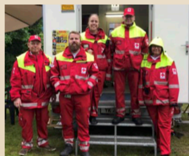
Samaritterne i nye uniformer.