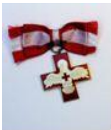
Røde Kors Fortjensttegn 1.

Frivillige der har fået en årsnål for deres indsats.