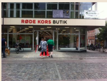
Genbrugsbutikken i Slagelse.