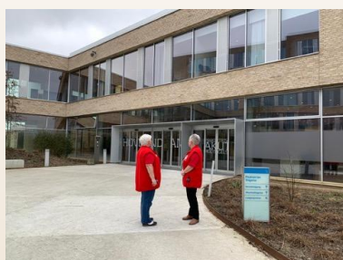
Patientstøtter ved PAM.