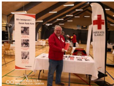
Formanden på inspirationsmesse.