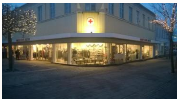
Genbrugsbutikken i Korsør.