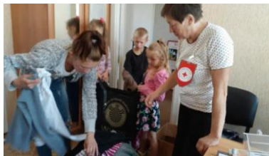
Børnefamilier i Hviderusland modtager nørkletøj fra Danmark.