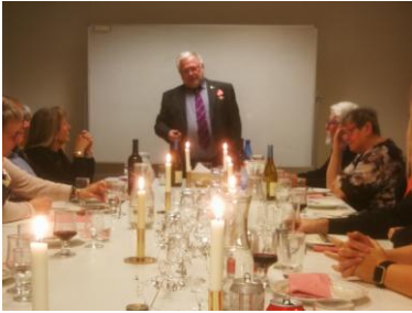
Nytårskuren i Slagelse.