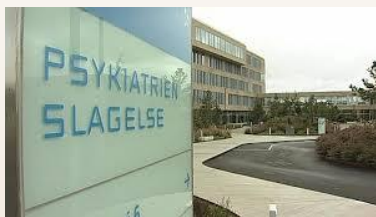
Psykiatrihospitalet i Slagelse.