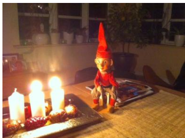
Hyggestund med den gamle nisse.