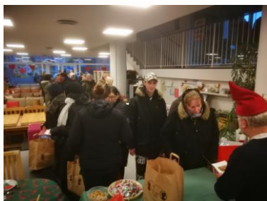
Uddeling af julehjælp.