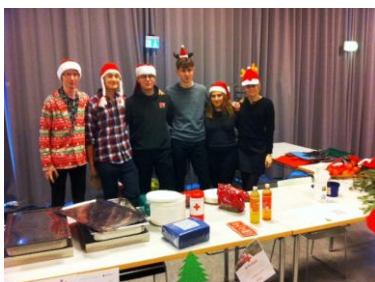
Elevrådet som står for juleindsamlingen.