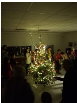
Dans om juletræet.